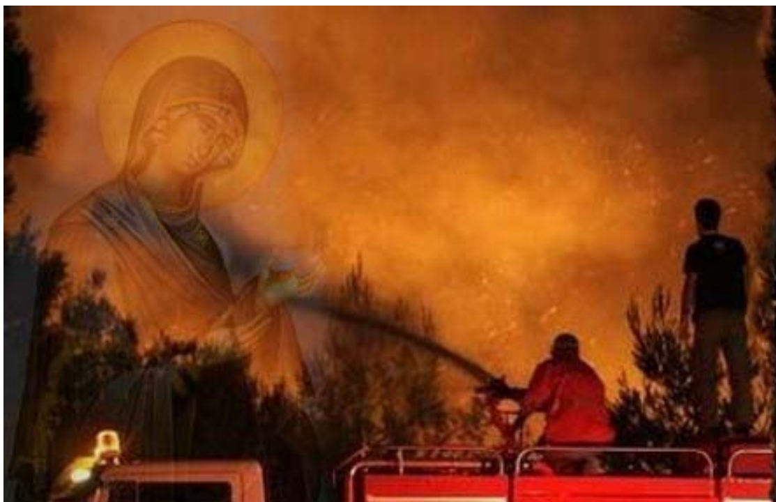
Εν τη Γεννήσει την παρθενίαν εφύλαξας, εν τη Κοιμήσει τον κόσμον ου κατέλειπες Θεοτόκε...